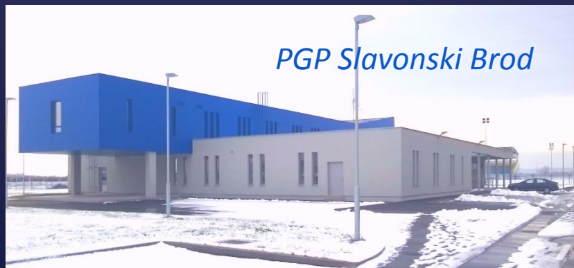
PGP Slavonski Brod