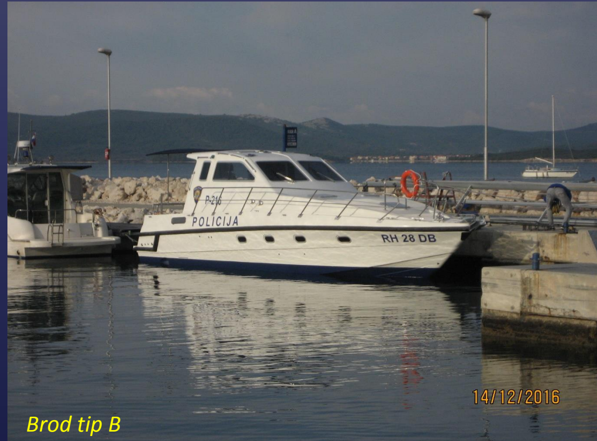
Brod tip B