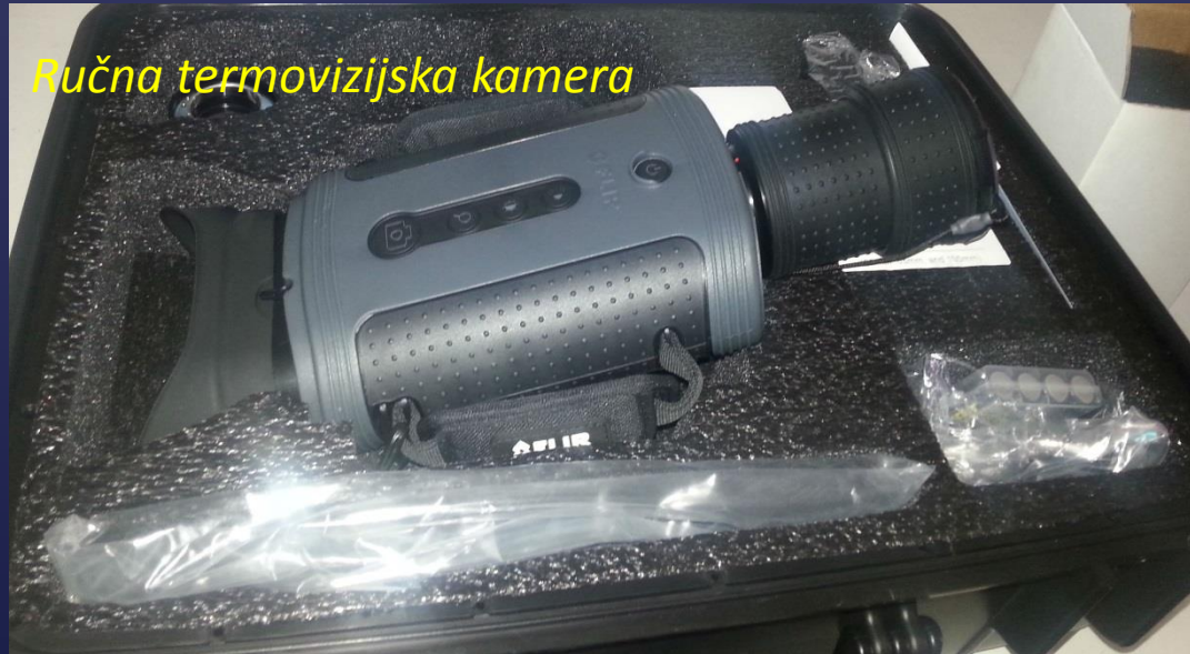
Ručna termovizijska kamera