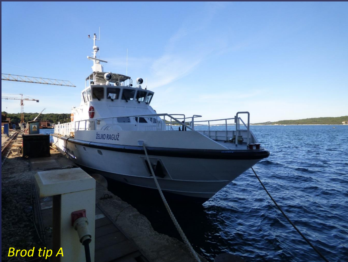
Brod tip A