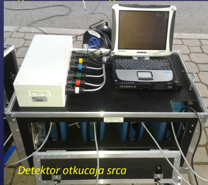
Detektor otkucaja srca